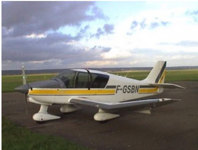
DR400 de l'Aéroclub Renault

Merci d'avoir lu ce document, bon vol, et n'oubliez pas vos lunettes de soleil !