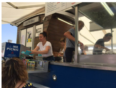
le P'tit bleu sur le port