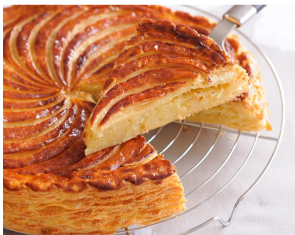
Une des nombreuses galettes...